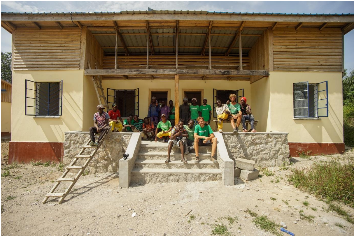
Krankenstation in Seremodu – fast geschafft!

Hochmotivierte und engagierte lokale und deutsche MitarbeiterInnen haben gemauert, Ringanker gegossen, Fenster geschweißt und Dachstühle aufgerichtet. In beiden Projekten stehen die Krankenschwestern schon vor Ort in den Startlöchern und warten gespannt und ungeduldig auf die Fertigstellung der Gebäude.